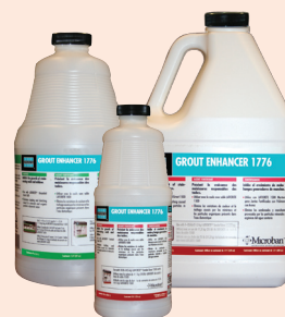
Data Sheet 265.0